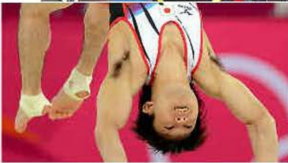
ロンドン五輪の体操・男子種目別でゆかの演技をする内村航平選手＝2012年8月

で、だ。「特殊な趣味かな」と思っていたが……。4月上旬、ベルリン郊外で合宿中のグエン選手を訪ね、単刀直入にわきの下のことを聞いてみた。「わきだけじゃなく手も脚も全部そってるよ。欧州では常識じゃないの」。今の若者らしい軽いのりのグエン選手に、こちらが思わず恥ずかしくなる。えっ、じゃあ、内村選手のわき毛は？ 「五輪の時、チーム内でも話題になっていましたよ。あの若者らしい軽いのりのグエン選手に、こちらが思わず恥ずかしくなる。えっ、じゃあ、内村選手のわき毛は？」 「おー、日本はそらないんだな」って。 やはり、だが、彼は一流のアスリートだ。水の抵抗