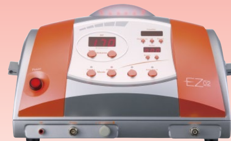
*この脱毛器は中古品です。