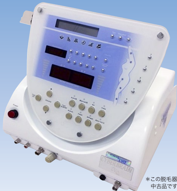
*この脱毛器は中古品です。